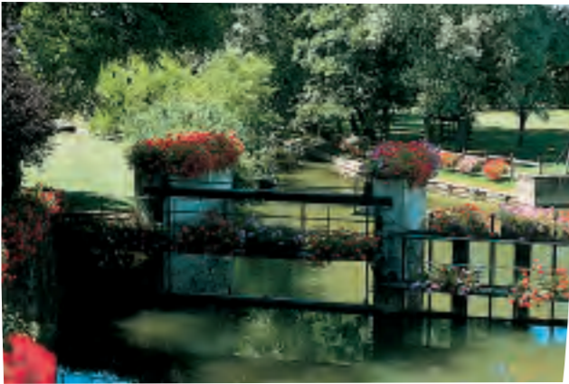
La Chalaronne s'écoule paisiblement entre Bresse et Dombes jusqu'à la Saône.