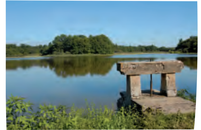
Quelques jours avant la pêche artisanale, l'étang est vidé de son eau grâce au "thou". Cette « vanne » autrefois en bois puis en ciment, est un symbole de la Dombes.